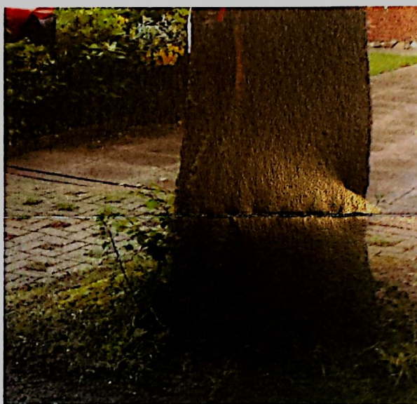
Wortelopschot, oorzaak is stress vanwege groeiplaatsinrichting en te hoge bodemverdichting